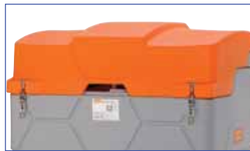
Kit complet capot