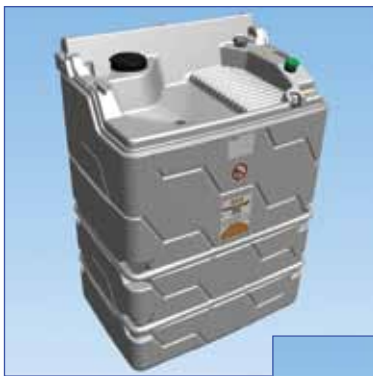
Cuve RECUP Cube Outdoor